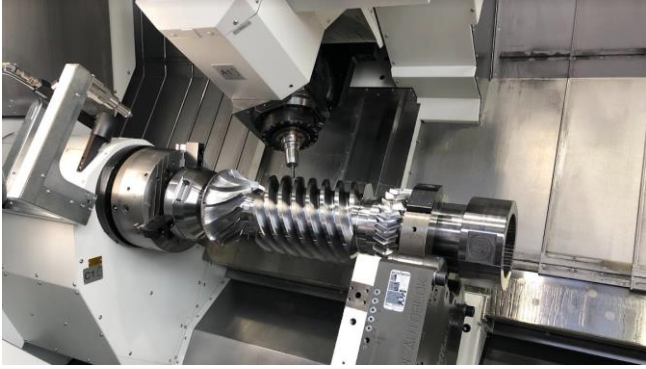
Usinage d'un axe en machine multi axes