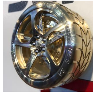
Pièce usinée sur tour multi axe en micro-usinage